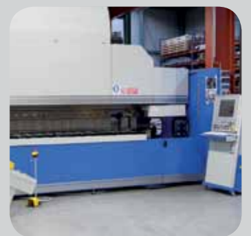
Biegezentrum in Kombination mit hochpräzisen 3-Punkt-Biegepressen