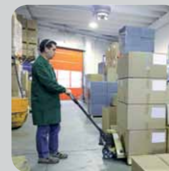
Just-in-time Bereitstellung und Lieferung