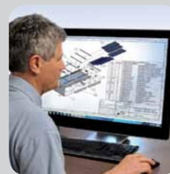
3D-CAD-System sowie State of the Art Industriedesign