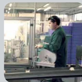
Umfangreiche Möglichkeiten zur Bauteilkonfektionierung