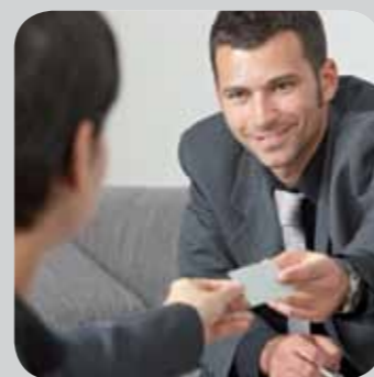
Kompetentes Team aus Spezialisten