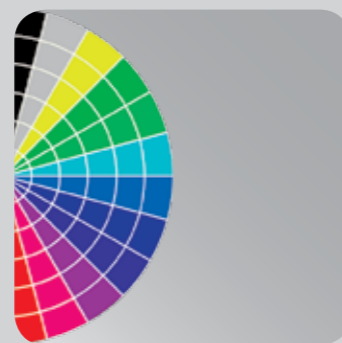
Verfahren und Systeme zur Oberflächenveredelung