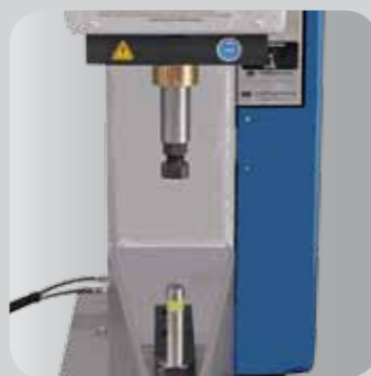
Verbindungs- und Endmontagesysteme