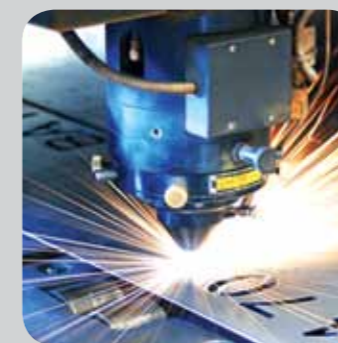
Schneid- und Schweiß-3D-Laserzentrum