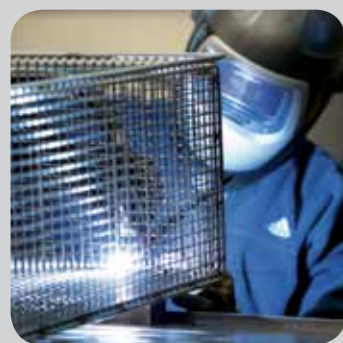
Schweiß- und Schweißmontagesysteme