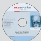
Level-One-Katalog CD-Version 90-896-39-07

Gebrüder Martin GmbH & Co. KG Ein Unternehmen der KLS Martin Group Ludwigstaler Str. 132 · 78532 Tuttlingen · Germany Postfach 60 · 78501 Tuttlingen · Germany Tel. +49 7461 706-0 · Fax +49 7461 706-193 info@klsmartin.com · www.klsmartin.com