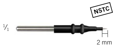
80-700-40-04 10 Wolfram-Mikro-Dissektionsnadel