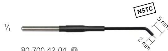
80-700-42-04 10 Wolfram-Mikro-Dissektionsnadel, 45°