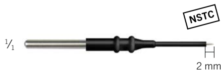
80-700-41-04 10 Wolfram-Mikro-Dissektionsnadel