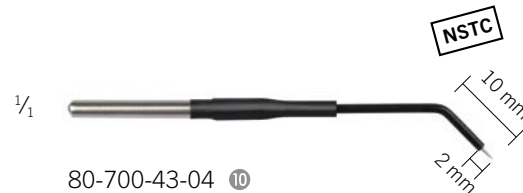
80-700-43-04 10 Wolfram-Mikro-Dissektionsnadel, 45°