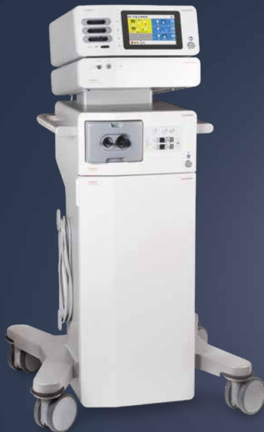
maxium® smart Cart